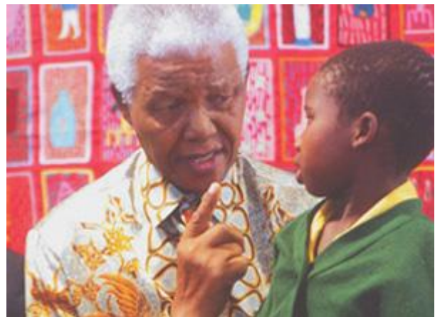
Madiba saam met een van sy gunsteling 'mense'.

Hierdie was 'n kunstenaarsvoorstelling van hom..