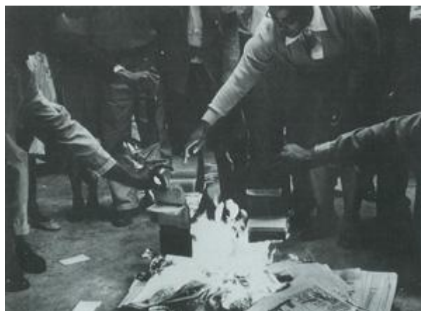
Die Versetveldtog - verbranding van passe.

In 1950 het die Regering die Wet op die Onderdrukking van Kommunisme uitgevaardig, wat effektiewelik die Kommunistiese Party – toe met 'n lidmaatskap van ongeveer 2500 – gelikwideer het. 'n Likwidateur is aangestel om die ontbinding van die Kommunistiese organisasie te oorsien en om 'n lys op trek van Kommuniste, voormalige Kommuniste en ondersteuners van die Kommuniste.