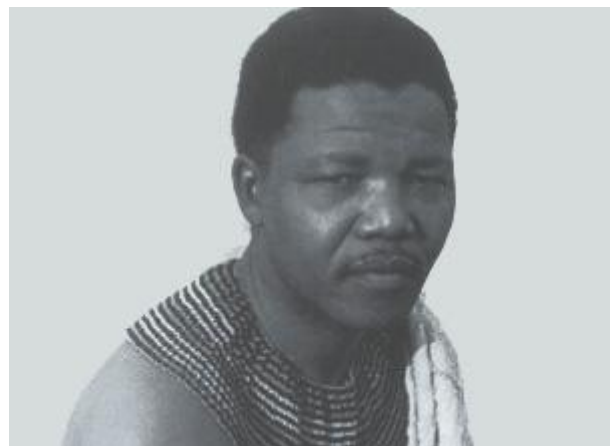
Soos wat hy verskyn het gedurende sy hofsaak in Oktober 1962

Mandela is verhoor in die Johannesburgse Streekhof vir die aanhitsing van 'n staking en die verlaat van die land sonder 'n paspoort en is skuldig bevind. Hy is gevonnis tot vyf jaar tronkstraf, en toe gestuur na Robbeneiland, waar hy in eensame aanhouding geplaas is.