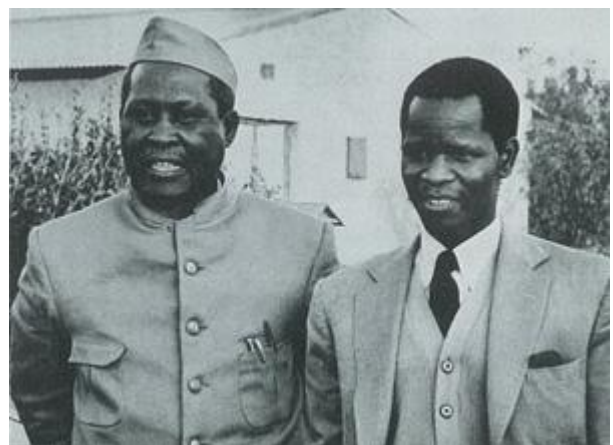
Albert Luthuli & Oliver Tambo - Beide is onthef van alle klagtes by die Hoogverraad-saak in 1958