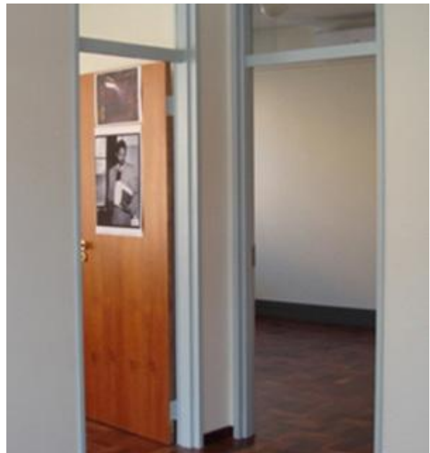
Die klein ontvangslokaal & kantore van Nelson Mandela & Oliver Tambo

Dit was ook, terwyl hy gewag het vir vonnisoplegging tydens die Rivonia-saak, dat hy sy LLB-eksamen geskryf en deurgekom het as 'n eksterne student deur Londen Universiteit. In 1967 het hy gevorder tot sy finale jaar, waar hy weereens vasgehaak het.