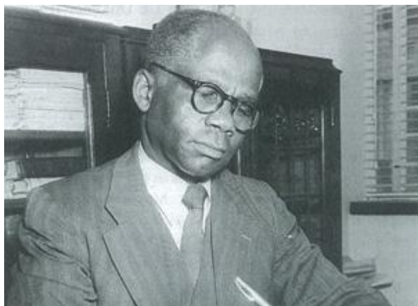
Dr. Alfred Xuma