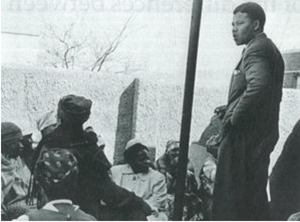
Nelson Mandela gedurende die veldtog teen passe vir vroue.