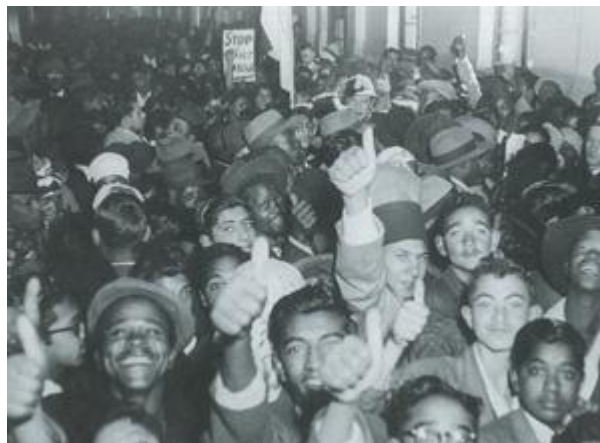
Ondersteuners by die hofsak.