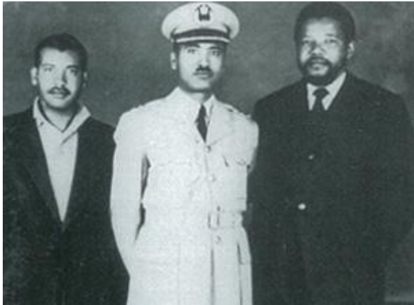
Mandela in Algerië 1962 - besoek militêre offisiere