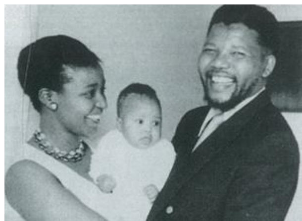
December 1960: Nelson & Winnie Mandela saam met hulle tweede dogter Zindzi

In Oktober 1960, het die Verwoerd-regering 'n referendum onder die blankes gehou om die land as 'n republiek te proklameer. Die meerderheid het in guns daarvan gestem.