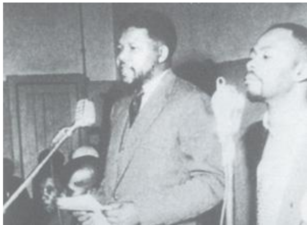
As spreker by die All-in-Conference in Pietermaritzburg - Mei 1961

Mandela het homself vinnig bewys as die beste openbare betrekkinge figuur vir die ANC. Toe die polisie toegeslaan het, het Mandela en sy mede-leiers op die vlug geslaan.