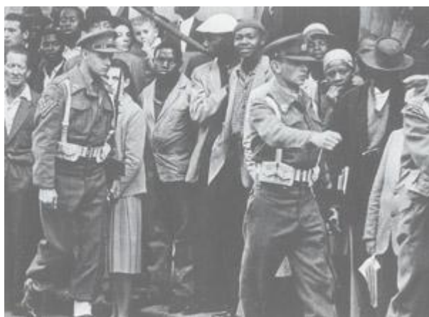
April 1960: 'n Noodtoestand is afgekondig - die Weermag in Johannesburg

Op 21 Maart 1960 het die Sharpeville menseslagting plaasgevind en in terme van die Wet op Onwettige Organisasies , is beide die PAC en die ANC verban. 'n Noodtoestand is afgekondig wat vir 156 dae sou duur – op een stadium is 21 000 mense aangehou by Modder B en ander aanhoudingskampe.