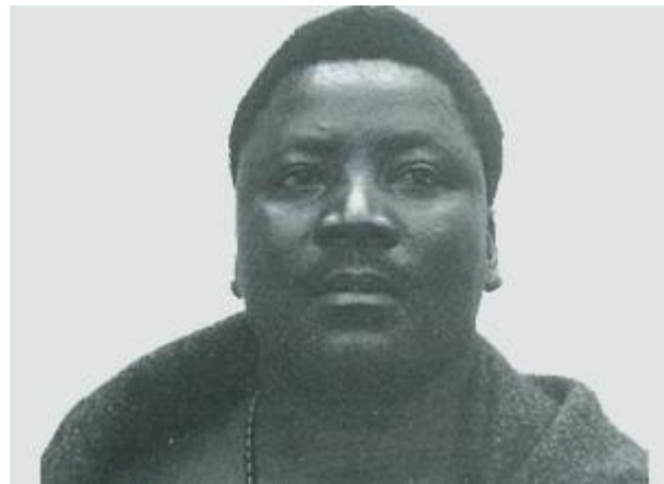
Mandela se voog Jongintaba Dalindyebo, wat hom groot gemaak het na die dood van sy pa.

Op die ouderdom van 16 het hy in die berge 'n besnydenisseremonie ondergaan, wat beteken het dat hy toe 'n man was. Kort hierna is hy in die stamhoof se motor na Clarkebury College geneem. Hierdie kollege is in 1825 deur Metodiste sendelinge gestig nadat die Thembu Koning, Ngubengcuka, aan hulle grond bewillig het. Hier het Mandela belofte as student getoon deur die Junior Sertifikaat in slegs twee jaar te voltooi.