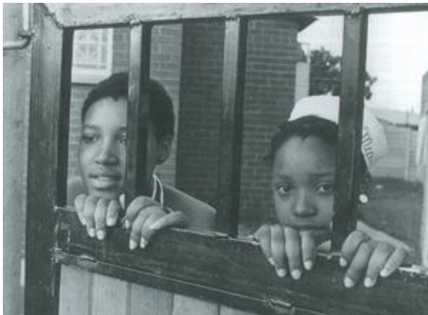
Die dogters van Nelson Mandela & Winnie Madikizela: Zindzi & Zenani

Mandela het herhaaldelik met regstappe gedreig indien die gesagstrukture hul eie reëls sou breek, en die firma se leggers oor Mandela dokumenteer 'n determinasie om die sisteem aan te vat met alles tot sy beskikking.