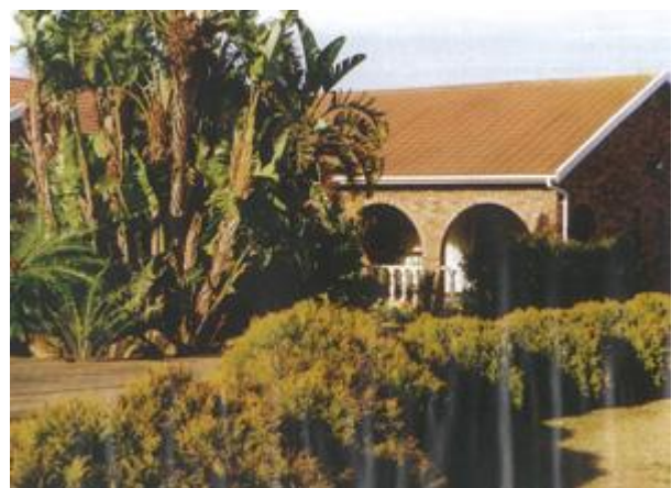
Mandela se voormalige aftree-huis in Qunu