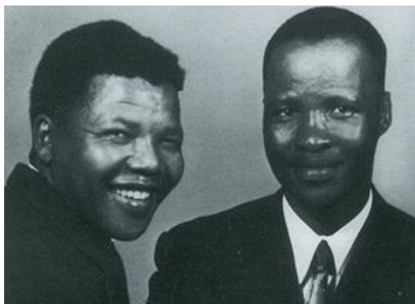
Nelson Mandela sy neef, KD Matanzima