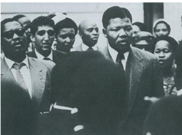
Mandela in die middel van 'n proteslied, Drill Hall, Johannesburg - 1956