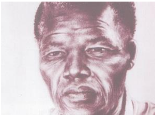
Vir 'n lang tydperk het die wêreld nie geweet hoe lyk Mandela nie.