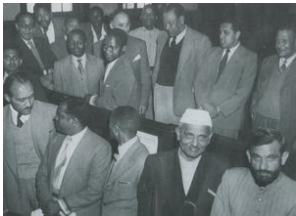
Twintig van die leiers wat aangekla is.

Op 20 Junie 1949, het die Minister van Justisie, C.R. Swart in die Senaat gesê: 'Natuurlik is ons magistrade en regters ook opgelei om 'n skelm te herken wanneer hulle een sien, en baie van hierdie Naturelle, het ek opgemerk, probeer maak asof hulle baie onskuldig is, en hulle is geensins so onskuldig as wat hulle lyk nie'.