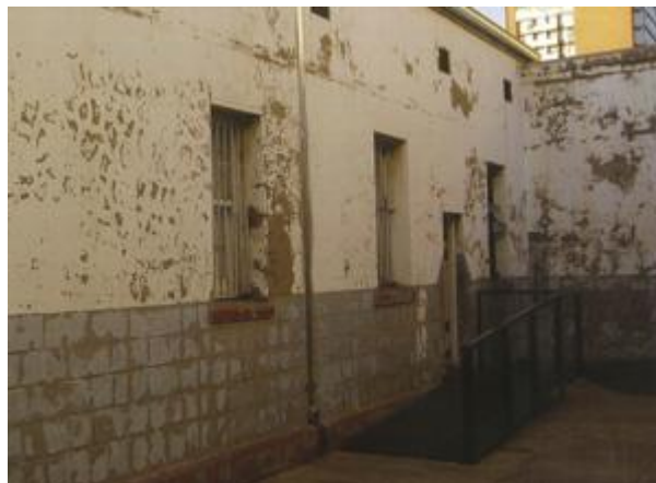
The Old Fort, waar Mandela twee keer aangehou is. Nou 'n gedeelte van die Constitution Hill buurt.