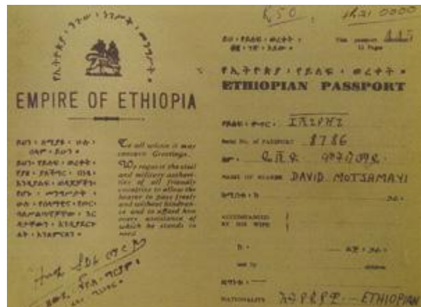
Mandela se vervalste paspoort in in die naam van David Motsamayi

Die veiligheidspolisie, wat gesê het hulle sal "die room afskep van die nie-blanke leierskap soos dit na bo kom" het begin met 'n mense-jag op Mandela en sy kollegas. Dit het aangehou vir 'n maand, maar daar het skaars 'n dag verby gegaan sonder dat Mandela die hoofopskrifte gehaal het. Daar was telefoonoproep na die redakteurs van koerante en Mandela – wat geheime vergaderings met joernaliste gehad het – het een van die bekendste stemme in Suid-Afrika geword.