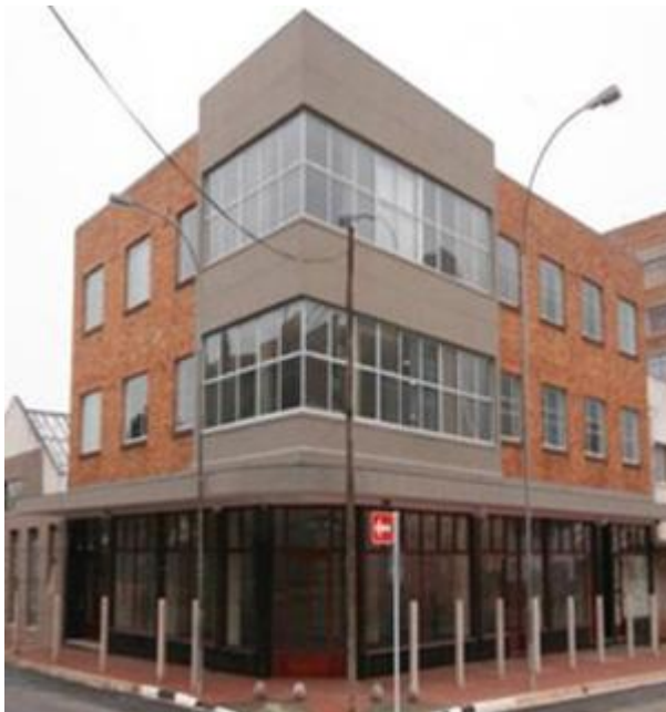
Chancellor House na die restourasie