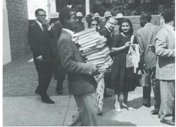
Die staat het 10 000 bewysstukke gelever vir die voorlopige verhoor

Die lang voorlopige verhoor het begin op 19 Desember 1956. Die staat het beweer dat die Vryheidshandfesse opgetrek is deur die ANC, SAIC, SAKP en COD, en dat dit stappe neerlê om die regering om ver tewerp en om 'n Kommunistiese bewind daar te stel; dat sommige van die beskuldigdes toesprake gemaak het waarin gevra is vir ekstra-parlementêre aksie om hierdie doel te verwesenlik, bv. 'n gewelddadige revolusie met bloedvergieting. Een van die advokate vir die verdediging, Vernon Berrange QC, het geargumenteer dat verraad klagtes teen die 156 het basies beloop op 'n politieke komplot, soos gefabriseerde klagtes tydens die Inkwisisie of die Reichstag-vure-saak in Duitsland. Die verdediging sou bewys dat die beskuldigdes "slagoffers was van politieke vlieër-vliegery vanweë hulle wat agter die vervolging gestaan het." "Hierdie is geen gewone saak nie", het hy gesê, "as mens ontsag het vir die kruiskop en trap manier waarop die arrestasies gedoen is."