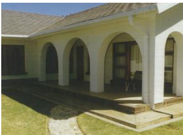
Die huis in die tronkgronde by Victor Verster

Die lede van die familie sou die eiendomme kon gebruik vir hul akkommodasie na eie goed denke.