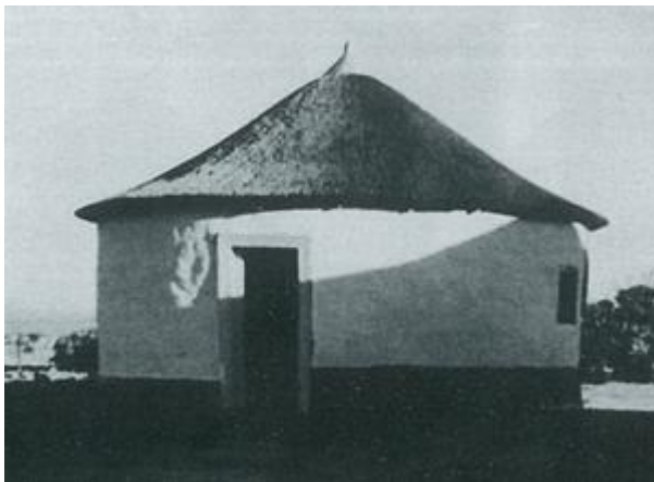
Die Rondawel by Die Groot Plek in Mqhekezweni waar Mandela as kind in die sorg van Jongintaba gewoon het