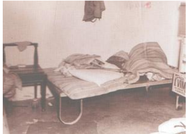
Rivonia slaapkwartiere terwyl op vrye voet

Mandela is per pad uit Suid-Afrika gesmokkel na Lobatsi in Botswana, en toe per vliegtuig na Addis Ababa. Volgens sy dagboek is Mandela beskou as 'n regeringsgas en 'uitspattig behandel' deur leiers soos Julius Nyerere, Habib Bourguiba, Sekou Toure, Leopold Senghor, Ben Balla van Nigerië en William Tubman van Liberië. In London het hy Hugh Gaitskell en Jo Grimmond van die Arbeidersparty ontmoet.